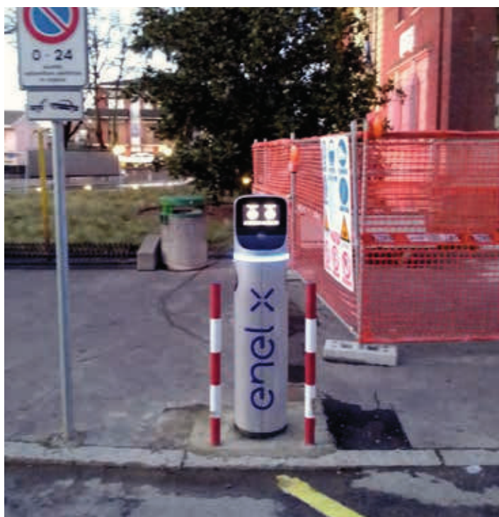
Infrastruttura di ricarica presso la sede municipale

mobilità ciclopedonale, favorire la sicurezza dei pedoni e spostare il traffico di attraversamento dal centro abitato.