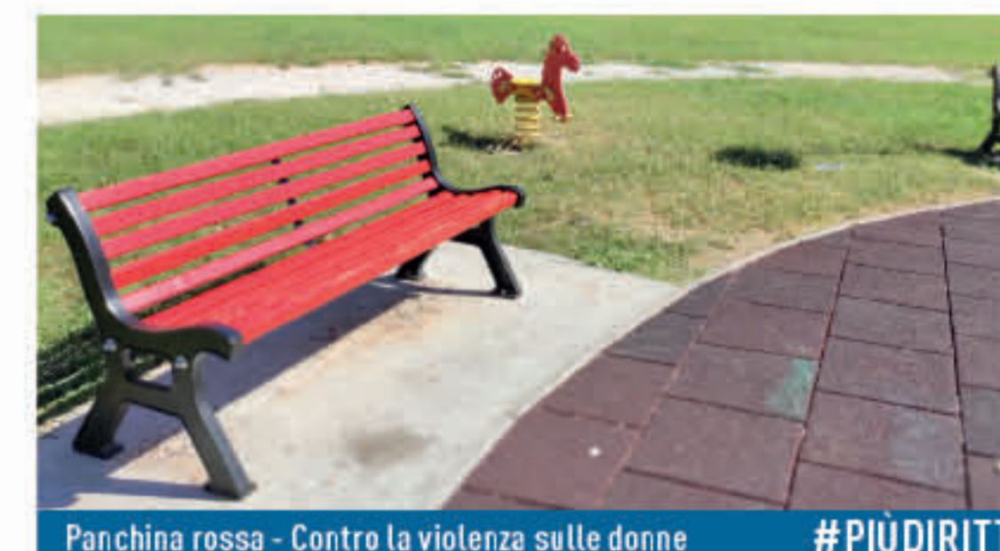
Panchina rossa - Contro la violenza sulle donne