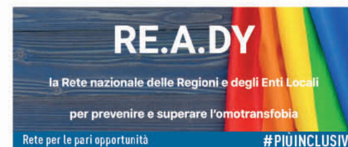
Rete per le pari opportunità