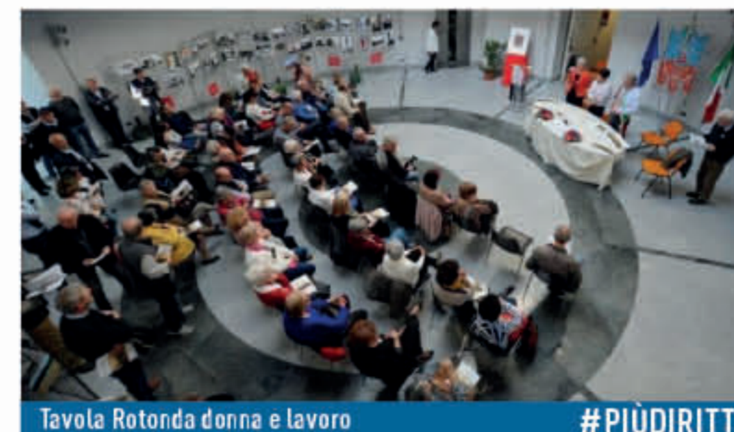
Tavola Rotonda donna e lavoro

Dobbiamo perseguire un contesto in cui tutti, uomini e donne, siano perfettamente liberi di scegliere, in assenza di condizionamenti personali e sociali con la possibilità per tutti di studiare e formarsi senza meccanismi discriminatori e frizioni di qualsiasi genere nel mercato del lavoro.