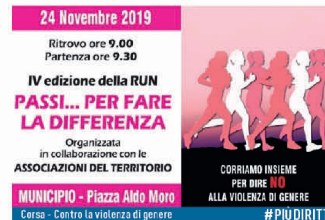
MUNICIPIO - Piazza Aldo Moro