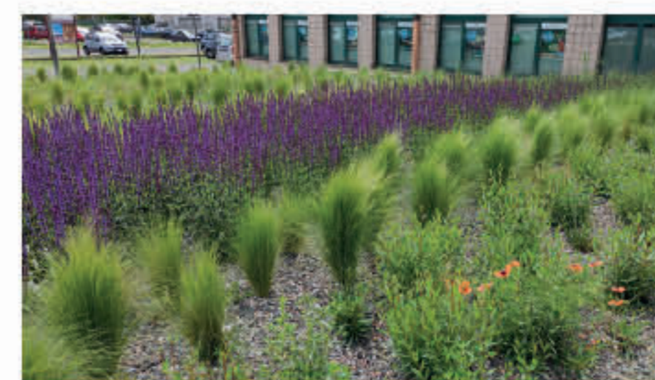
Piantumazione per api #PIUSOSTENIBILE