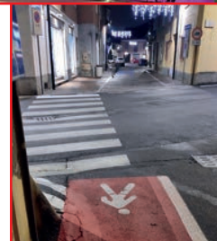
Passaggio pedonale Pellico - C. della Vittoria