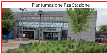
Piantumazione Pza Stazione