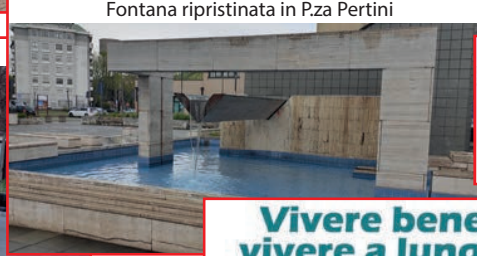
Fontana ripristinata in Pza Pertini