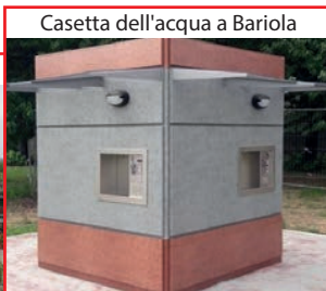
Casetta dell'acqua a Bariola