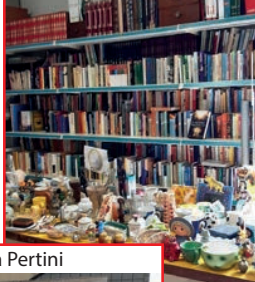
Ampliamento Isola del Riuso