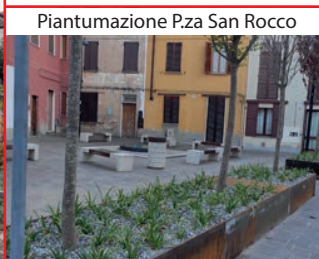
Piantumazione Pza San Rocco