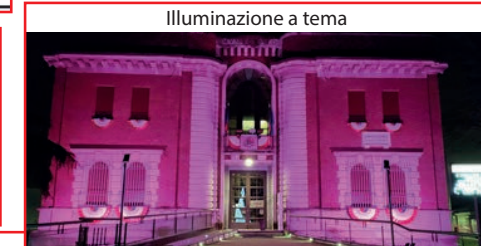
Illuminazione a tema