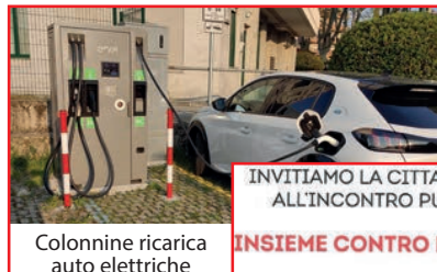
Colonnine ricarica auto elettriche

INVITIAMO LA CITTADINANZA ALL'INCONTRO PUBBLICO INSIEME CONTRO LE TRUFFE DOMENICA 16 FEBBRAIO ORE 16:45 BIBLIOTECA CIVICA