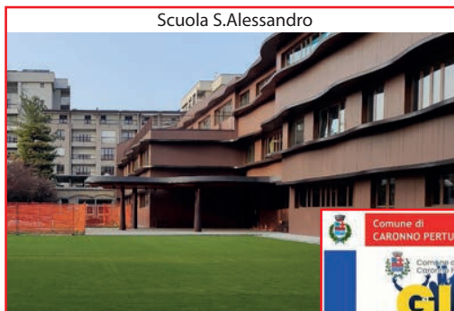
Scuola S. Alessandro

A proposito di programma amministrativo, facciamo appello ai cittadini che volessero dare il loro contributo di inviare i propri suggerimenti all'indirizzo e-mail pd.caronnopertusella@gmail.com .