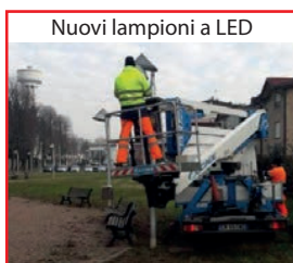
Nuovi lampioni a LED

Per essere informati: - seguitemi sulla pagina Facebook Circolo PD Caronno Pertusella - visitate il sito www.PDCaronnoPertusella.it Per richieste di informazioni e per le vostre proposte scrivete a: PD.CaronnoPertusella@gmail.com